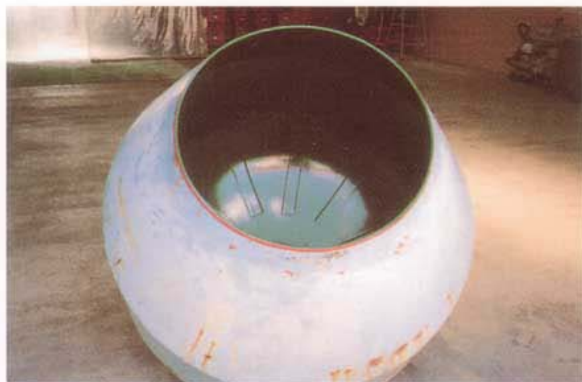
粉体用ドラムミキサー