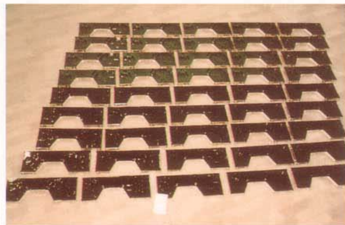
自動化ライントレイ